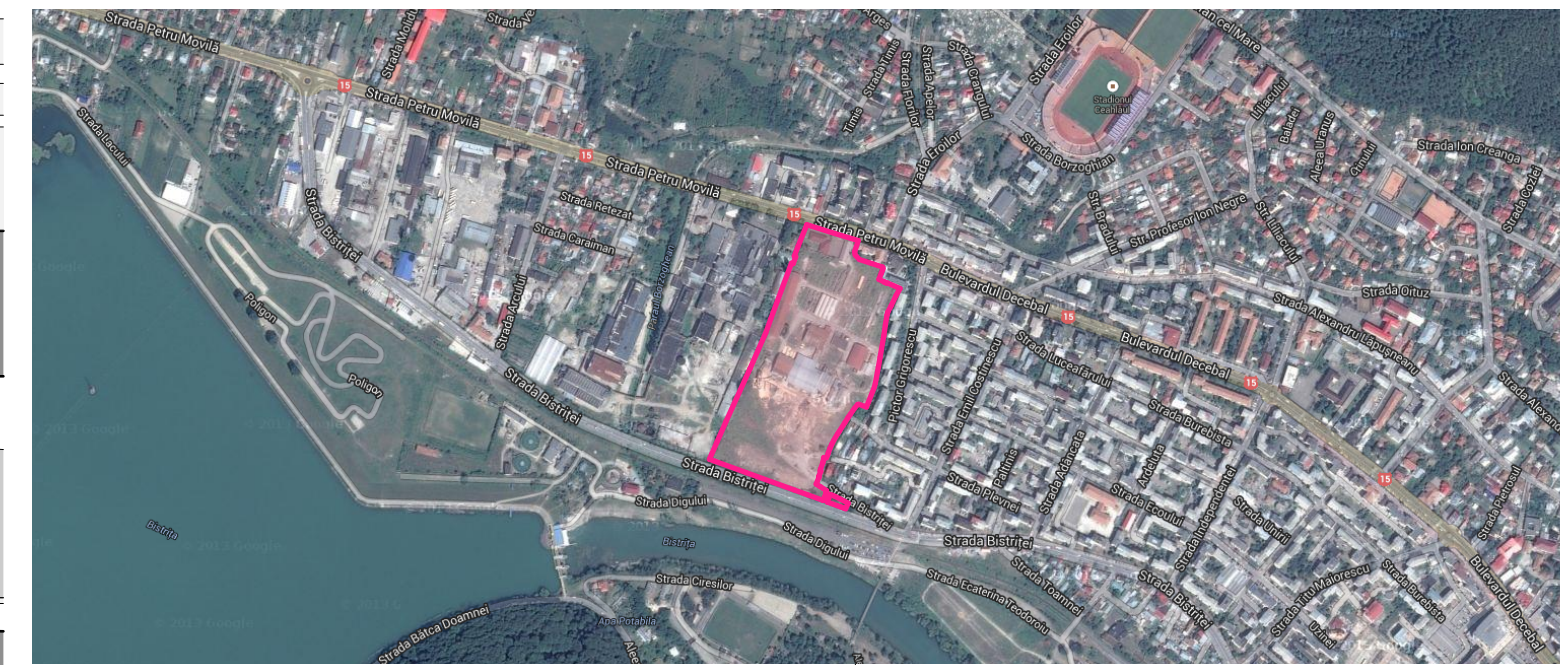
BILANT TERITORIAL PE AMPLASAMENT SC NEPI THREE BUILDING MANAGEMENT SRL: