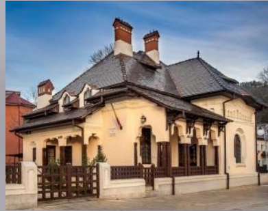
Muzeul de Etnografie

În cadrul proiectului, au fost executate intervenții asupra următoarelor obiective de patrimoniu