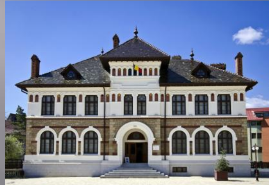
Muzeul de Artă