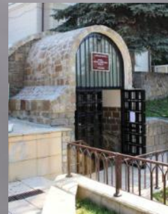
Ruinele beciului și ruinele zidului de incintă ale Curții Domnești