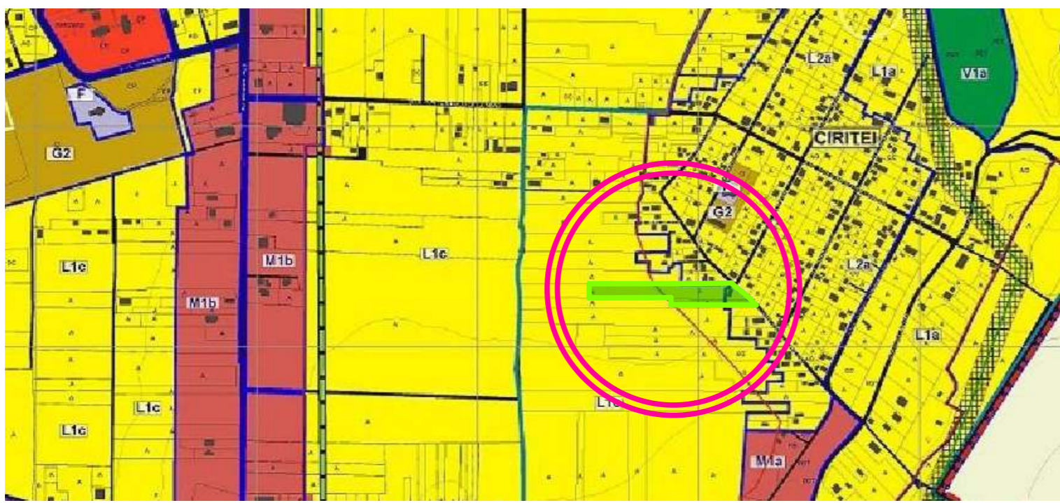
PLAN DE INCADRARE IN ZONA scara 1/5000