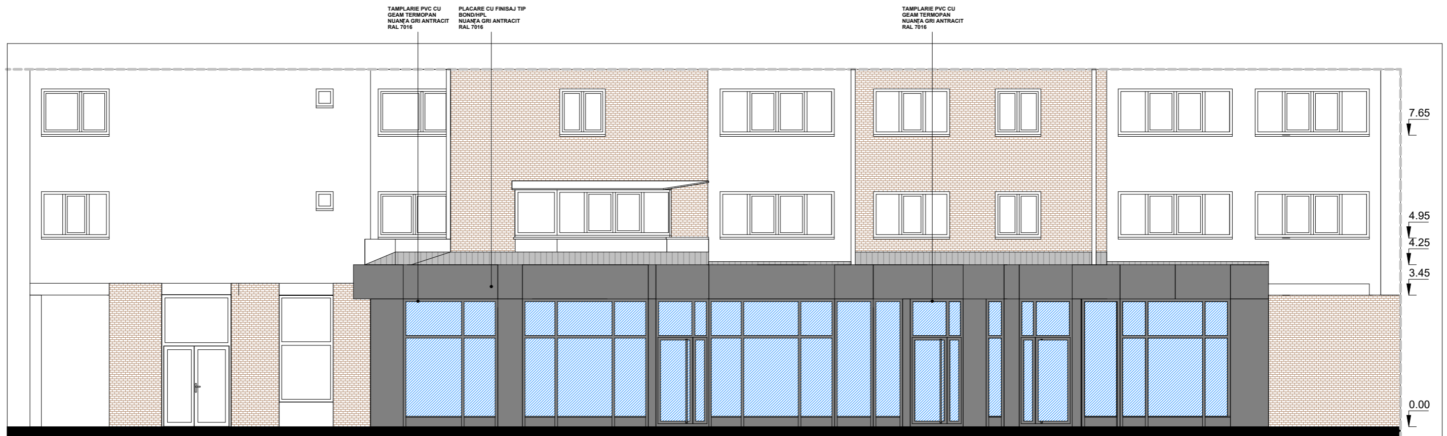
1 PROPUS_DESFASURATA_BLVD GRAL DASCALESCU